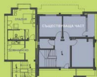
РАЗПРЕДЕЛЕНИЕ КОТА +3,45