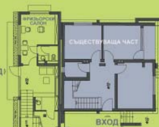
РАЗПРЕДЕЛЕНИЕ КОТА +0,00

На нота ±0,00 /първо ниво на пристройката/ са разположени антре, стълбище за горните нива, портиерно със склад и фризьорски салон със санитарен възел. Първото ниво на съществуващата жилищна част е на нота +0,02, на която се превързват двете външни тераси към новоизградената носеща конструкция.