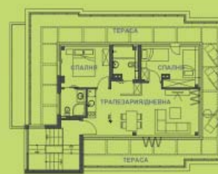
РАЗПРЕДЕЛЕНИЕ КОТА +9,15

В това число: на пристройка и надстройка - 500.11 м 2 на съществуващата сграда - 171.26 м 2